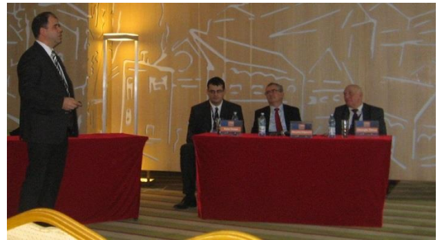
Participare la Conferința Institutului Regional de Oncologie Iași, CONFER 2014, 27-30 noiembrie 2014, Iași, Romania.