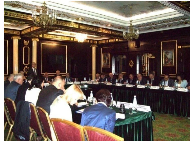
Participare la VIII Съезд онкологов и радиологов стран СНГ и Евразии, 16-18 septembrie 2014, Cazani, Rusia.